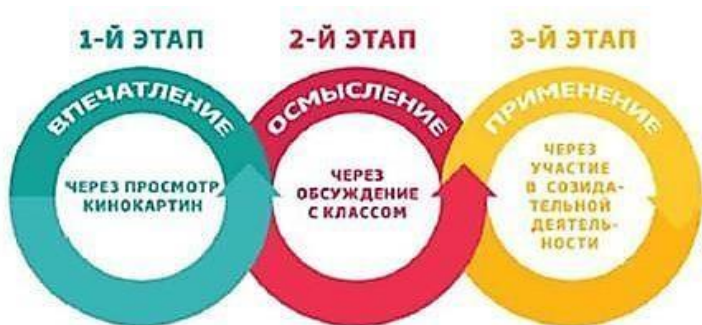
Рис. 1. Этапы проведения киноуроков

3) важный результат киноурока – возникшая у школьников потребность подражания героям, которая реализуется в ходе проведения социальной практики , – общественно полезного дела, инициированного детьми и позволяющего проявить рассматриваемое качество личности на практике.